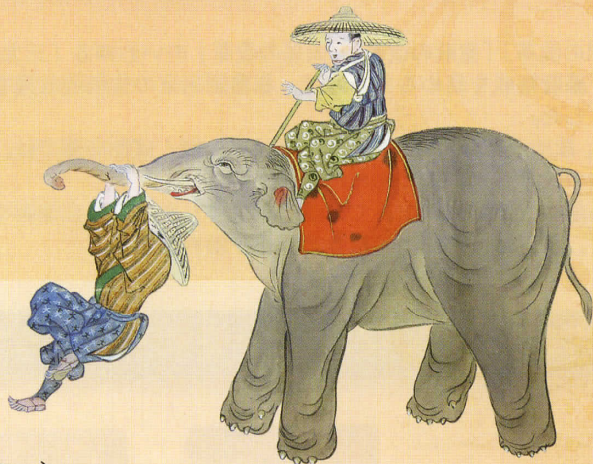
象之絵巻物 (関西大学図書館蔵)