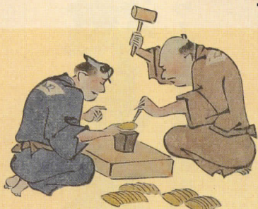
金吹方之図