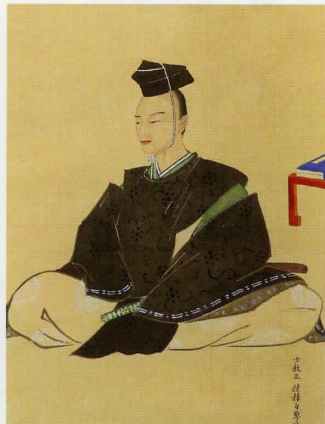
田沼意次像 (牧之原市史料館蔵)