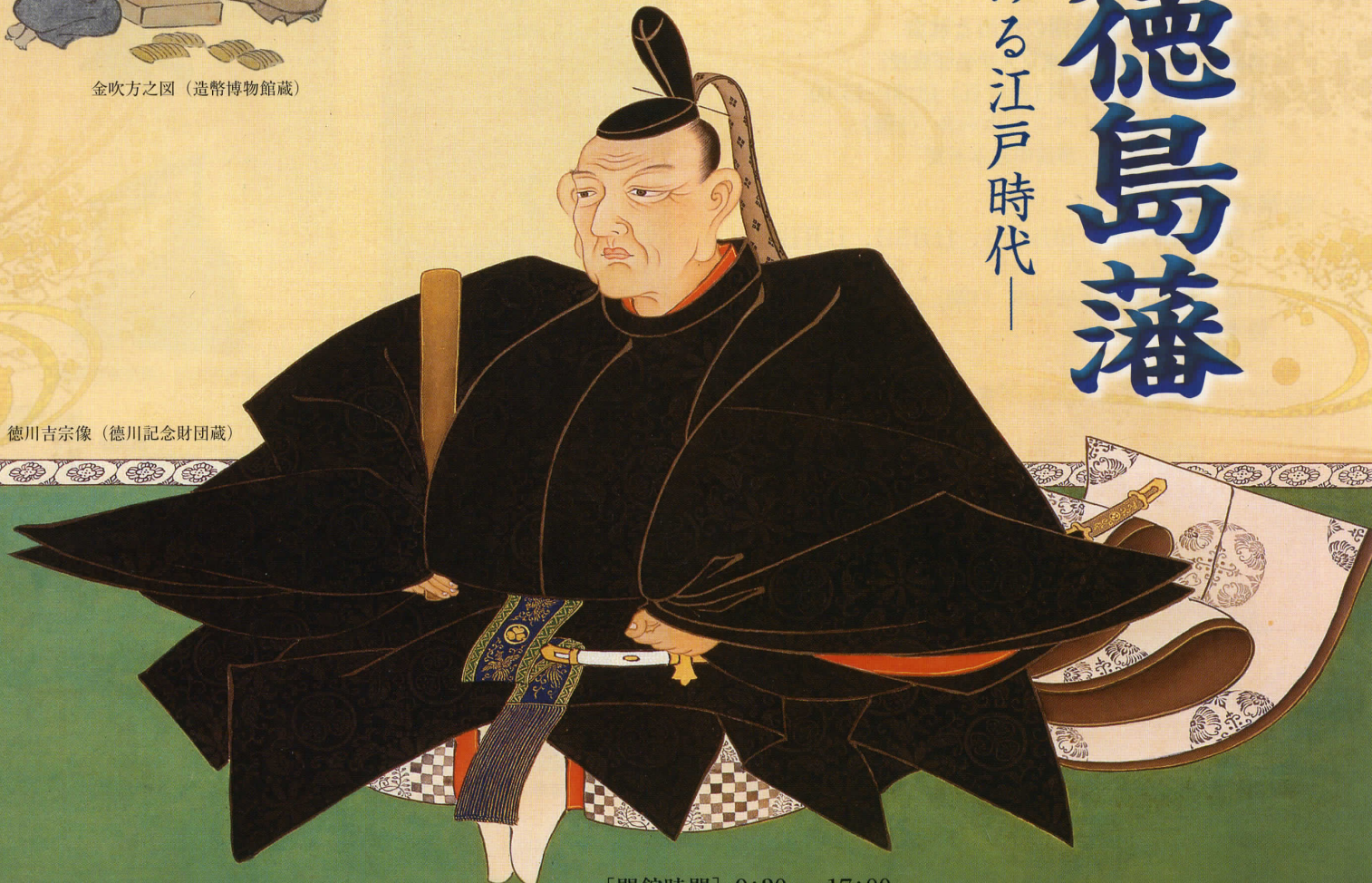
徳川吉宗像 (徳川記念財団蔵)