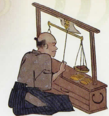
金吹方之図 (造幣博物館蔵)