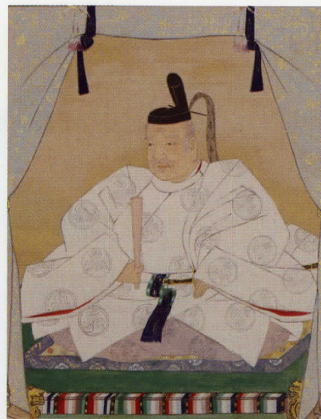
東照宮御影 九月十七日拝礼 伝狩野探幽筆 (徳川家康像) (徳川記念財団蔵)

日時：10月15日、10月29日、11月5日、11月19日 14:00~15:00 (いずれも日曜日) 会場：博物館企画展示室 (1階) 備考：観覧料が必要