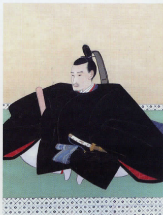
水野忠邦像 (首都大学東京図書館蔵)