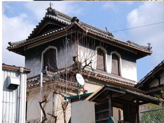
上の 3 枚の写真は木造 4 階建てで 4 階は中国風の窓をめぐらし、城の本丸あるいは望楼のようです。(島尾菓子店)