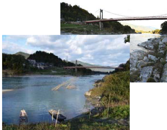
吉野川の渡し跡付近のようす