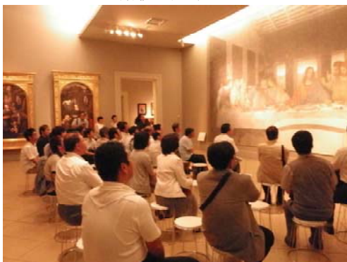
西洋名画「最後の晚餐」の鑑賞