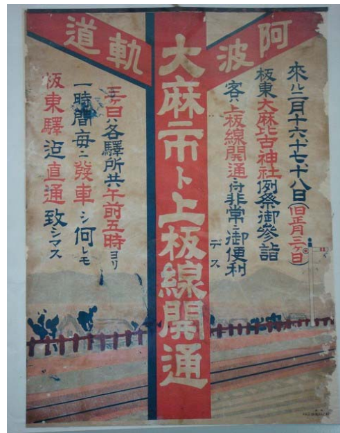
開通を知らせるポスター