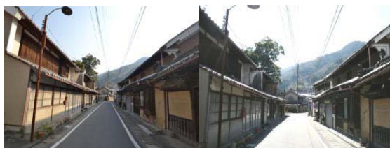
保存したい辻の町並み

〒 779-4802 三好市井川町岡野前 64 TEL 0883-78-4311