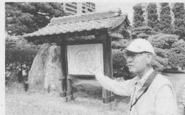
ボランティアによる庭園の案内