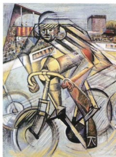
メッツァンジェ ＜自転車乗り＞1911-12年

☆特別展「開園30周年記念「ドイツ20世紀アート」一人・対話・みらい～フロイデ!ドイツ・ニーダーザクセン州友好展覧会～」