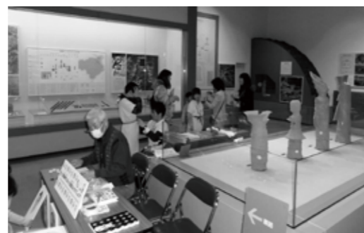
ボランティアスタッフによる 博物館常設展示室でのイベントのようす (平成27年2月11日)